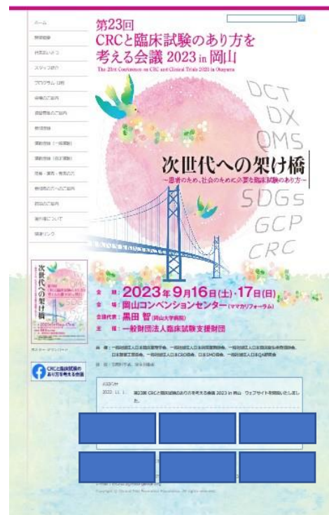
バナー広告掲載位置(イメージ図)